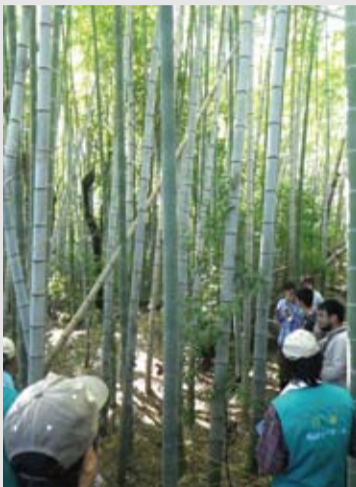
里山を歩きながら議論する地元の学生とNPOの人たち