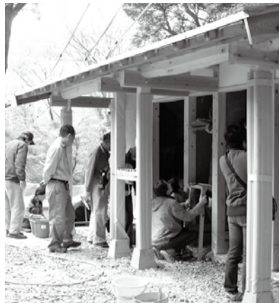
写真上=東谷山山頂で建屋づくりに励む親子ら 写真右=建屋の中に設置されるバイオトイレ(「瀧澤」カタログより)