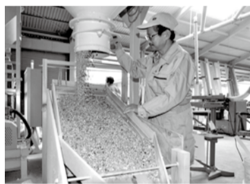
守山区にある専用の機械で1日60袋(600キ)ほどを生産

専用のペレットストーブは20~50万円ほどが相場で、設置条件も限られ、名古屋ではまだ普及しているとはいえません。それで