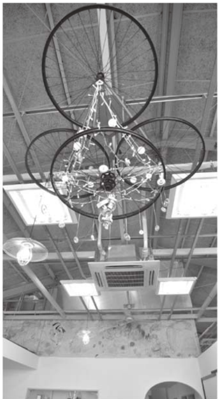
北区の「アトリエ・ブルート」でつくられた自転車部品によるシャンデリア

西区の名鉄「栄生」駅近くにある「サイクルサービスなごや」(TEL 052-551-2662)。4年前にオープンした「就労継続支援A型事業所」で、障害のある人たち十数人が放置自転車や中古自転車の整備に取り組んでいます。