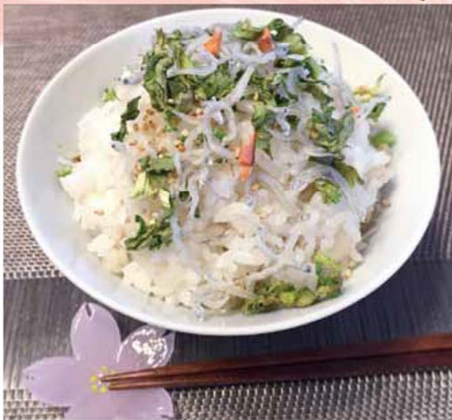
「へた」も使っておいしいごはん