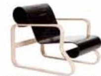
椅子(41 アームチェア パイミオ) アルヴァ・アアルト 1931-1932年 アルテック 個人蔵

4月7日(金)~5月28日(日)まで愛知県美術館で開催される「フィンランド・デザイン展」の入場券をペアで。約100年間を6つのセクションに分けて、各時代の主要なデザイナーや、彼らを支え、育ててきた企業にスポットを当てて紹介。●問い合わせ/同美術館 TEL 052-971-5511