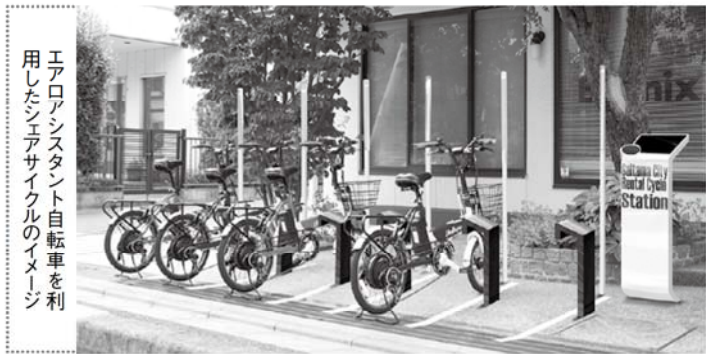
エアロアシスタント自転車を利 用した「エコサイクル」のイメージ

バッテリーやモーターの小型化にはこだわり、コンパクトでおしゃれなデザインは2008年度の「グッドデザイン