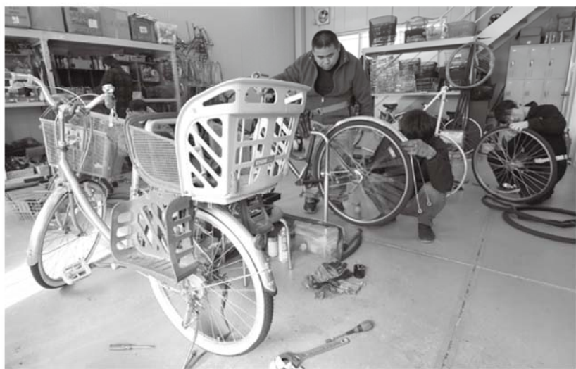
放置自転車などを整備する西区の事業所「サイクルサービスなごや」

ここで余った部品を譲り受けているのが、北区の「アトリエ・ブルート」(TEL 052-508-9034)。同じく障害福祉サービスに取り組む認定NPO法