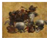
市画不詳レオナルド・ダ・ヴィンチに基づく「タヴォラ・ドーリア」複製画。Gabriello Fagnano della Galleria degli Uffizi

2018年1月13日(土)から名古屋市博物館(瑞穂区)で開催される展覧会の入場券をペアで5組に。日本初公開の〈タヴォラ・ドーリア〉を含む51点を展示。壁面の模写や派生作品、ダ・ヴィンチの多岐にわたる活動の紹介も。●問い合わせ/同館 TEL 052-853-2655