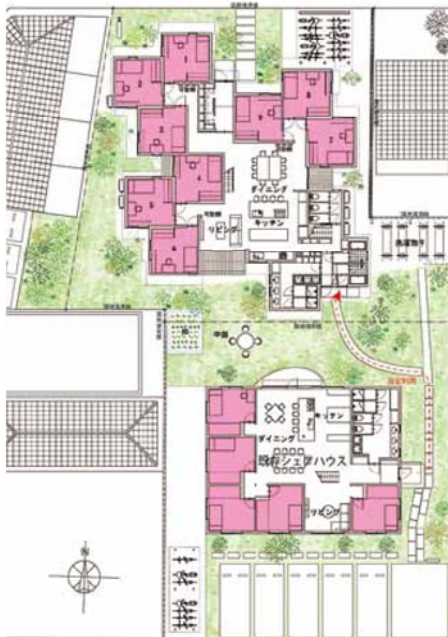
1階平面図。中庭を挟んで北側に「LT城西2」。ピンクの個室以外は共用施設(鈴木崇真建築設計事務所、諸江一紀建築設計事務所提供)

「畑の野菜や、親から送られてきた食べ物をみんなで分けることもあります。それぞれ仕事を持っているので、いつも顔を合わせるわけではなく「ほほど」の距離感がいい。大きなキッチンや畑も使えて、ぜいたくです