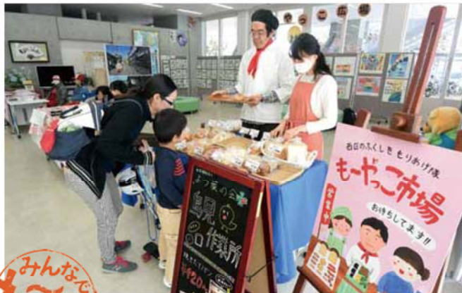
西区役所1階で開かれる「もーやっこ市場」。焼き立てパンや弁当が人気。左下は「もーやっこ計画」のロゴマーク

「もーやっこ」は会合を意味する「催合い(もやい)」や船をつなぎ合わせる「舳い(もやい)」などが語源とされています。「このお菓子、もーやっこでね」は「このお菓子を仲良く分けてね」という意味。そこから「いいことも困ったこともみんな分分かち合い、助け合ってより暮らしやすく魅力的なまちにしていこう」という西区の区政運営方針