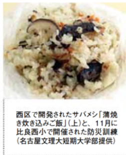
西区で開発されたサバメシ「蒲焼き炊き込みご飯」(上)と、11月に比良西小で開催された防災訓練

西区版「サバメシ」の開発は今年度までの3カ年計画。区はレシピをまとめたリーフレットなどを発行し、普及啓発を進めています。