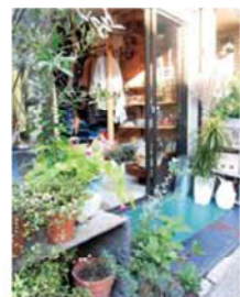
ナチュラルな雰囲気 の1号店の店構え

店舗目がオープンしました。店舗を持たない作家たちが期間限定のお店を出すイベントスペースという位置づけ。従来はスペースの関係で並べられなかったものや、新しいものを提案する空間として、アクセサリや花など、さまざまなショップが期間限定で開かれます。12月はSOMEがSOMEtに出店…って、少しややこしいですが(笑)、後者のほうがスペースが広いので、ゆっくり古着を見ることが出来ます。店内もコンクリート