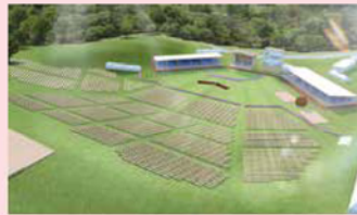
式典エリアイメージ図