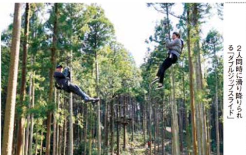
2人同時に滑り降りられるダブルジップスライド

しました。長さ100m以上のワイヤからぶら下がって一気に滑り降りる「ジップスライド」は、国内でも珍しい2本平行の「ダブル」。2人が手をつないで降りることもできます。高さ10