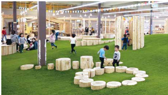
起伏のある人工芝の周りを木のショップが囲む「moriwaku market 輪之内店」。名古屋にあった「moriwaku cafe」も

ショッピングセンター内のスーパーマーケット跡を改装。養老店は木のジャングルジムやハンモック、輪之内店は起伏のある人工芝を囲んで雑貨や本、飲食の「一坪ショップ」が並びます。昨年12月まで名古屋の伏見地区にあった「moriwaku cafe (モリワクカフェ)」もそれぞれに入店。木に囲まれながらオーガニックなランチやコーヒーで一息