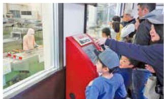
地元の名産「えびせんべい」の工場見学も

く勉強になりました。仕事で来られなかった主人とも一緒に、またやってみたい」と感想を寄せてくれました。