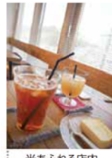
光あふれる店内でティータイム

代にとって、自宅周辺のことを何も知らないという思いは男女かわらぬはずあるのではないのでしょうか?