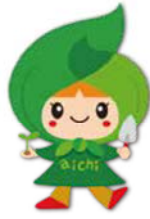
「森すきんちゃん」 マスコットキャラクター