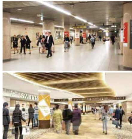
伏見駅構内にも2019年度開業の「駅ナカ商業施設」で大きく変わる(上:現在の伏見駅構内。下:駅ナカのイメージ)

兼用のトイレは、女性専用や身障者用の設置を進めています。さらに身障者が利用できるエレベーター設置などバリアフリー化も計画。中と、誰もが利用しやすい地下街として、環境面にも配慮がされています。