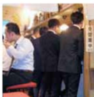
羽根つき餃子とハイボール 目当ての客で連日盛況

伏見地下街の立ち飲み屋 の先駆けとなったのが、二 〇一五年十二月オープン の日本酒が楽しめる「伏見立 呑おお島」。当時、居酒 屋のあり方と将来性を考 えて、立ち飲み屋の出店を 計画しました。「この地下