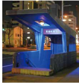
地上からの入り口にはデジタルサイネージ設置予定

予定。多言語1コイン(500円)クーポンとあわせて、海外からの観光客を増やしたい考えです。