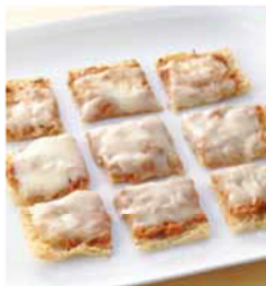
料理提供: ベターホームのお料理教室