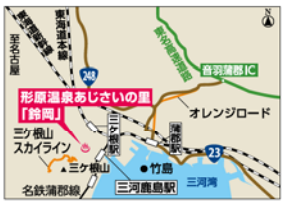
愛知県蒲郡市金平町遊名田3-14 TEL 0533-57-8111

間で、十万人が訪れる。夜間はライトアップで青や紫、赤や白など花の色が鮮やかさを増す。池の水面に明かりが揺れて朱塗りの橋が映える。蛍の宿ではゲンジボタルが乱舞する。