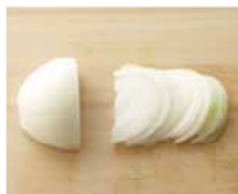
切り落とした根の部分が横になるように置いて切る

たら、中央に少し赤みが残るくらいで。刺し身で食べられるたら、さるにとり、さらにペーパータオルで水気をしっかりとふくと、水っぽくなりません。新タマネギで作るときは辛みは少ないので、水にさらす作業は省いてください。