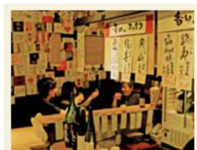
ちょい飲みが楽しめる地下街の店 (伏見立呑 おお島)