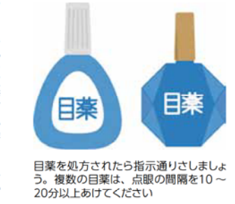
目薬を処方されたら指示通りさしましょう。複数の目薬は、点眼の間隔を10~20分以上あけてください

予見するのは困難です。遠視気味の人に起こることが多いため、視力がよくても40歳を過ぎたら一度は眼科で検診をしましょう。 発症数が多い慢性的に眼圧が上がるタイプも、自覚症状があまりありません。まわりから視野が欠けていくため、進行しても自覚できないことも。特に日本人は、点眼を開始する場合もありません。複数の点眼液でも眼圧低下が十分でなく、視野障害が進む時には手術を行います。