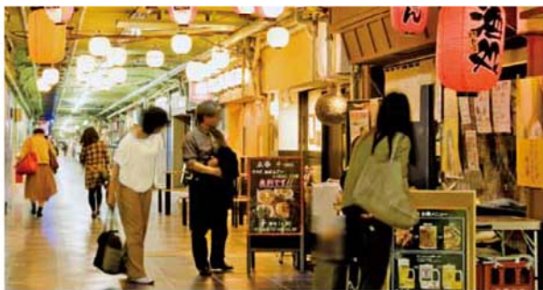
通勤利用だけではなく、立ち飲み目当ての人も増えた地下街

ふれる一杯飲み屋横丁に愛 所として人気となつていま す。一品300円ほどのメ ニューが多く、1500円 程で「ちょい飲み」が楽し めです。敬老バスを使い、 毎日のように足を運ぶシニ アも珍しくないとのこと。