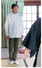
足(すり足)は簡単そうだが、ちょっと種古した足がガクガクに