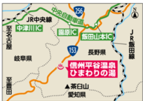
長野県平谷村252 TEL 0265-48-2911

山の色が鮮やかで、空の青さが目にしみる。夜は満天の星が輝く。宿泊施設の「ひまわりの館」の造りは宿場風で落ち着いた。あじわい処「ひまわり亭」では、山菜、川魚の塩焼き、馬刺しなどの郷土料理が楽しめる。