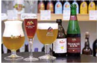
から、魔性を秘めたビールと称される「デュベル」、 熟発酵させたランビック・ビール「ブーン・フランボ ズ」、ホワイトビールの「パーテルリーヴェン・ヴィ 」。ほかにも「ドゥシス デ プルゴーニユ」、トラピスト ール「シメイ・ブルー」を試飲。