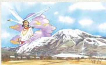
伊吹山とヤマトタケル 絵 高藤 暁子

滋賀県の最高峰、伊吹山の山頂には、剣を片手にしたヤマトタケルの石像があります。ヤマトタケルは、父、景行天皇の命で東征し、草薙剣を手に各地で豪族や荒神を討伐。帰路、伊吹山の神に素手で戦いを挑み、敗れて伊勢で息絶えました。魂は鳥となり天に昇つたと伝えられています。(古事記より)