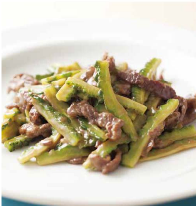
料理提供：ベターホームのお料理教室 / 料理写真：松島 均