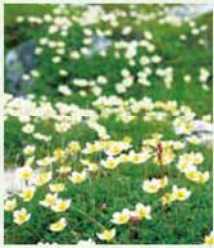
中央アルプスの宝剣岳(2,931m)では、7月いっぱいチングルマの群落を見ることが出来る

「若い頃のような挑戦心や冒険心を満たすのではなく、自然との触れ合いを大切にしています」と長山伸作さん。「体力の限界を知る単独登山、若手経営戦略塾仲間との登山、妻や友人と自然に親しむ山登り、山野草を