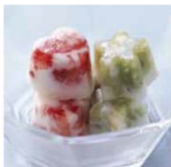
料理提供：ベターホームのお料理教室