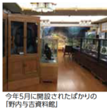
今年5月に開設されたばかりの「野内与吉資料館」

の方に支えられたら、大玉村にある温泉旅館「金泉閣」の大広間の中に今年5月に資料館をオープン。鉄道工事の工具や与吉の遺品、古代アンデス文明時代の土器や民族楽器、衣装など貴重な資料もあり、地域を活性化させる場になっていきたいですね。