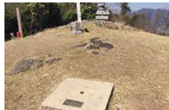
吉祥山頂の菱形基線測点(手前)と三等三角点(奥)

山登り。山野草や鳥のさえずりを楽しむ、信仰の山を巡る。文学の山を訪ねる…。自分スタイルの大人の山登りもいろいろです。