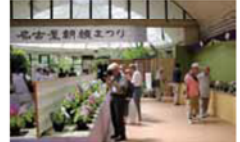
昨年の名古屋朝顔まつりより

7月26日(水)~30日(日)、名城公園フラワープラザ(名城公園北園内)で「名古屋朝顔まつり」が開催される。夏を代表する草花である朝顔。奈良時代、遣唐使によって中国から葉草として渡来したといわれる。名古屋朝顔は、正式には「名古屋式盆栽切込みづくり大輪朝顔」といい、名古屋が発祥でおよそ100年の歴史がある。名古屋朝顔の苗・種などの販売やしの苗の演奏(雨天中止)、「花の標本作り」、「名古屋朝顔押し花教室」といった体験イベントも。◆展示時間/9:00~12:00 ◆問い合わせ/同プラザ TEL 052-913-0087