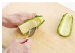
種とわたは一緒に、スプーンでこそげとる

るときは、スプーンを使うと簡単。縦半分に切り、スプーンで種とわたを一緒にこそげとります。 興酒を使うと本格的な香りに仕上がりますが、なければ料理酒でも。調味料をもみこんだら、最後に片栗粉でコーティング。粉が肉のうま味を閉じ込めて、口あたりがやわらかく仕上がります。