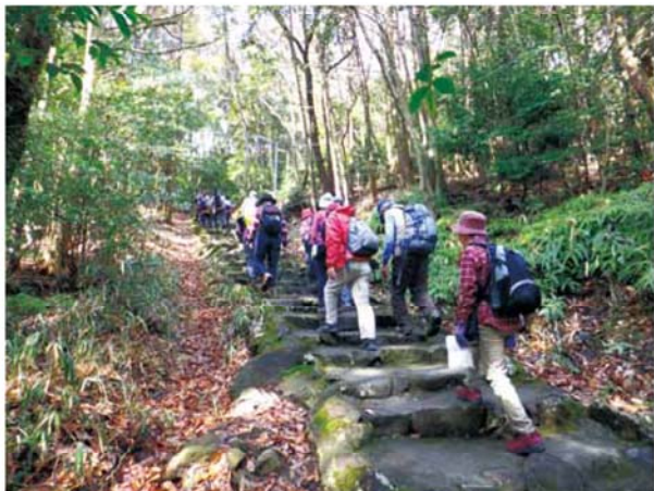
ことし2月、名古屋最高峰の東谷山(198.3m)へ登る「ふわく山の会」メンバー。40～80代までの山登り愛好家32人が参加

ほかに、映画に登場する山、干支に関わる山、日本酒の名前に使われている山など興味のある分野から山登りの計画を立て、散策