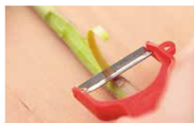
アスパラガスの切り口を落とし、硬い皮はむいて使う

することで火通りがよくなります。調味料をもみこむ時は、手でよくもみこむと味がしかりしみます。下味と一緒に片栗粉をもみこむことで衣がつき、肉がコーティングされて、揚げるとまみや水分が逃げずにジュシーに仕上がります。