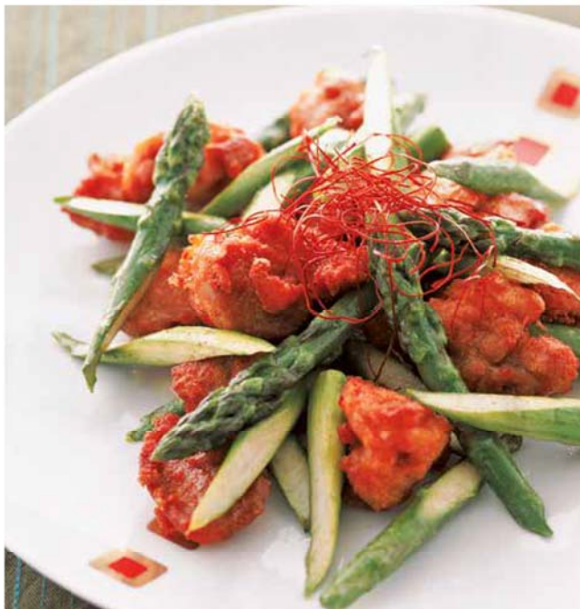
料理提供: ベターホームのお料理教室