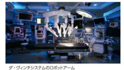
ダ・ヴィンチシステムのロボットアーム

ロボットは、人と話をしたり、自動で車を生産したりするような作業はできません。ロボットアームと手術する術者の手の動きを忠実に再現するロボットのことで。