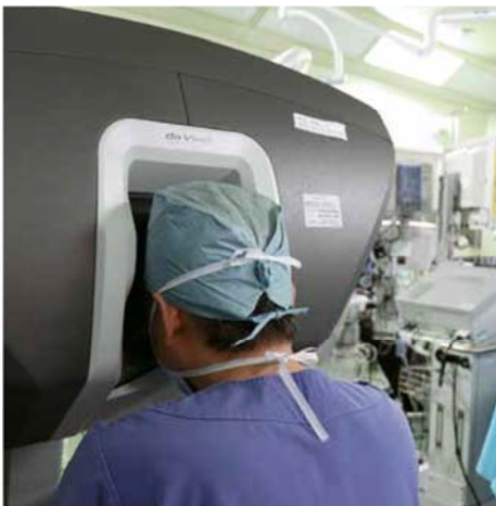
手術が術者でロボットを操作するコンソールから手術をし、奥のロボットアームで術者の手の動きを忠実に再現する

栗の本体の岐阜県恵那市に本店や工場を構える。創業六十一年の老舗で石川橋店は二〇〇五年に開いた。