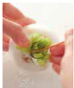
茎の間の汚れは、竹串などで取り除く

「カブのさつとゆでサラダ」は、粒マスタード風味の簡単サラダ。カブの茎は少し残すことで、彩りも良くなります。茎の間に汚れがあれば、竹串などで水を流しながらよく洗いましょ。