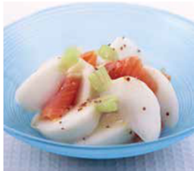
料理提供：ベターホームのお料理教室