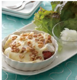
料理提供: ベターホームのお料理教室