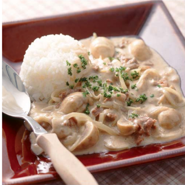
料理提供: ベターホームのお料理教室