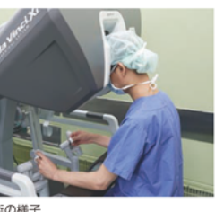
ロボット支援下手術の様子

増加傾向の前立腺がん これまで米国で多く、日本では少なかつた前立腺がんが、近年増加しています。最新の統計によると、一年間に新たに前立腺がんが診断される男性は、胃がん、大腸がん、肺がんに次いで四番目に多いと予測されています(表1)。