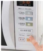
短めの時間から、様子を見ながら加熱を

などで構いません。生クリームを使うことで、粉を炒める手間なく作れます。また、バターは小さく切ったのせると、均一に混ぜやすくなります。なお、レンジの加熱時間は5分程度です。600Wなら時間を0.8倍、800Wの場合は0.6倍を目安に短縮できますが、機種によって異なるので様子を見ながら加熱し