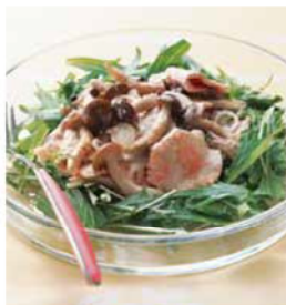
料理提供: ベターホームのお料理教室