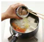
サバ水煮缶は、缶詰ごと入れます