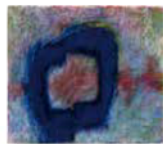
(Oct.20-95) / 1995年/パステル、紙/個人蔵◎辰野晴、平出利恵子

名古屋美術館(中区栄2)で2月16日(土)から3月31日(日)まで開催。日本の抽象絵画の新たな可能性を示したことで高い評価を得た辰野登恵子(1950-2014)。大型の油彩画で知られる辰野ですが、本展ではドローイングなど紙の上の表現に焦点をあて油彩30点を含む220点あまりの作品で初期から晩年までを回顧します。一般1,200円、大高生700円。