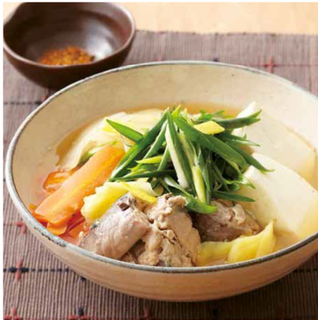
料理提供: ベターホームのお料理教室 / 料理写真: 大井一範