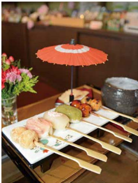
◆名古屋市中白区八事山101(八事園園駐車場前) ◆だんごやさんセット880円(だんごの種類は折々に異なる。彼岸、お盆の前、年末年始は販売休止) ◆営業時間/9:00~16:00(土・日曜日、祝日は~17:00) ◆休み/木曜日 ◆TEL 052-838-5005