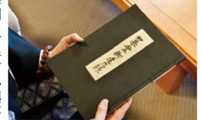
「如来堂御建立録」。この記録があったことで如来堂の建立時期などが判明し、国宝となった

なりました。上人は伊勢湾岸沿いから福井にかけて教えを広め、津の一身田に無量寿院を建て、拠点の一つとされました。しかし、栃木の専修寺が戦火で焼失したため、上人は無量寿院に疎開され、トップが移られたことで無量寿院が本山としての役割を担うようになり、定着していききました。栃木の専修寺もその後再建され、高田派では本寺と呼んでいます。 「真宗がよく耳にする他力本願とはどんな教えですか？」 他力とは他者の力ではなく、阿彌陀如来の働きを意味します。「自力による厳しい修行を積み重ねてもお浄土に行けるよ」という阿彌陀如来が救ってくださるから、南無阿彌陀仏といって手を合わせなさいよ」と任向けていた宗の教えです。お葬式に行くのも法事にお参りするのにも先祖や亡くなった人のためではなく、手を合わせると阿彌陀如来がそういう場所に連れていってくださるので、自分の欲望をかなえるために手を合わせる人が多いかと思いますが、まったく違う感覚です。