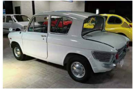
(上)これは珍しいマツダ。エレガントなセダンスタイルは今見ても美しく、個性的(下)白いインテリアはやはり多員でもおしゃやかな雰囲気を感じられる

たような優雅なリアスタイルが特徴で、これで後部座席の頭上空間を稼いでいた。ただ、