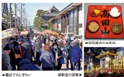
▲露店で大にぎわい 御影堂の宮殿▶

お七夜では、親鸞聖人ご二代の物語が描かれた「御絵伝」が掲げられるのも習わし。期間中は、雲幽園の特別公開やお非時の特別提供、提灯の夜間ライトアップなどが見られるまたとない機会です。