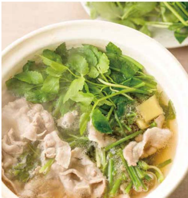
料理提供：ベターホームのお料理教室 / 料理写真：鈴木 正美