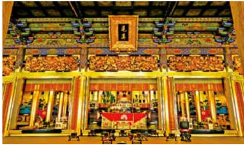
金箔や極彩色の彫刻が施された御影堂の中陣・内陣

宸筆を原本として製作された貴重なものです。精緻で流麗「如来堂」御影堂と対をなす如来