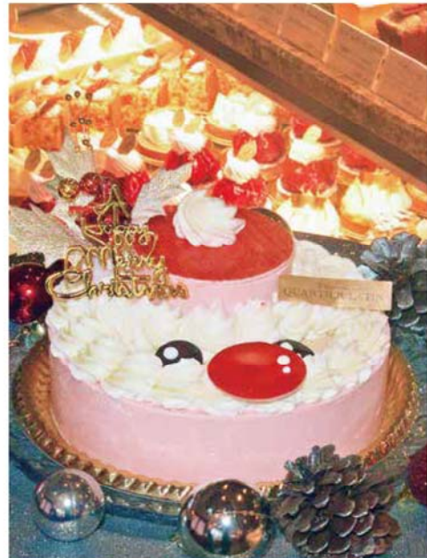
◆名古屋市中川区十番町2-4(地下鉄名港線六番町駅下車、国道1号沿い西へ徒歩6分) ◆クリスマスケーキ2,800円〜、モンブラン500円など(税別) ◆営業時間/10:00~19:30(喫茶はL.O.19:00) ◆休み/火曜日、第2水曜日 ◆TEL 052-661-3496