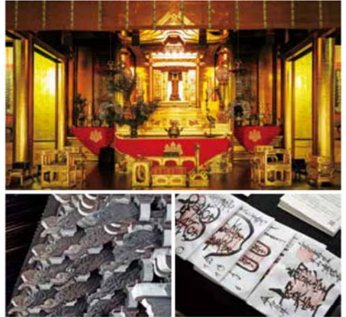
(上) 如来堂の絢爛華麗な装飾は必見 (右下) 参拝記念の御朱印

内部には、黄金に輝く絢爛な造りの宮殿(国宝)があり、中には快慶作の阿弥陀如来立像(国指定重要文化財)が安置されています。向かって右側に七高僧像、左に聖徳太子の絵の軸物が掛けられています。御影堂が巨大な建築物であるのに対し、