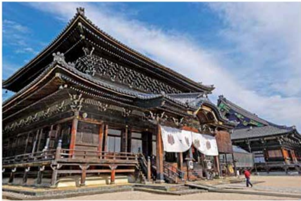
三重県津市の高田本山専修寺の御影堂(奥)と如来堂(手前)。高度な建築技術と卓越した装飾技術により荘厳な信仰の空間を創出し、近世寺院建築として極めて高い価値を有しています

真宗高田派の本山として崇敬され、名古屋にも別院がある三重県津市の専修寺。広大な境内地を有し、豪壮な七堂伽藍が立ち並び様は庄巻です。二〇一七(平成二十九年)年には国宝の「御影堂」と「如来堂」が三重県内の建造物としては初めて国宝に指定され、全国的にその名が知れ渡るように。今回、御影堂と如来堂の魅力を紹介いたします。