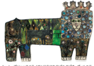
ルート・ブリュック「ライオンに化けたロバ(タピオ・ヴィルカラ ルート・ブリュック財団蔵 Tapio Wirkkala Rut Bryk Foundation's Collection / EMMA - Espoo Museum of Modern Art KIKUJASTO, Helsinki & JASPAR, Tokyo, 2018 C2531)

フィンランドを代表する陶芸家の日本で初めての回顧展。名業アラビアの専属アーティストとして長年にわたり活動し、北欧デザイン・工芸ブームの一翼を担ったルート・ブリュック。陶器、テキスタイル、版画など約200点の作品を通じて、創作の軌跡をたどります。岐阜県現代陶芸美術館(多治見)で8月16日(日)まで。入場料は一般900円、大学生700円、高校生以下無料。要事前予約。最新の開館状況は同館HPへ。