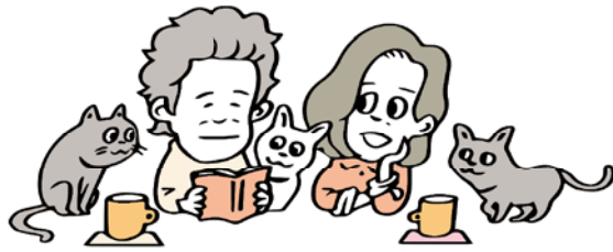
イラスト/ヤギ ワタル

我慢できる距離……絶縁 か、年賀状のやりとりだけ か、盆暮れに電話するくら いは大丈夫か……を保って 暮らすのが、お互いベスト ではなからうか。