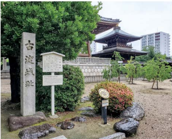
城址碑は東別院敷地の南西の角にある

寺、鳴海、そして刈谷・安城方面へつながる。この頃信秀は三河安城までを手中に収め、一時的に岡崎城まで攻め込んでいた。有名な小豆坂の戦いの時も、古渡が信秀の本拠地だったし、齋藤道三の美濃へもここから出陣している。どこへ行くにも最適な場所なのだ。また古渡城の東は那古