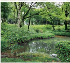
東別院北東にある下茶屋公園の池は、江戸時代には古渡城の堀跡と言われていた

野城(現在の名古屋城二の丸庭園の辺り)を今川義元の弟である今川氏豊から奪って、津島近くの勝幡城から移ってきた信秀は、その