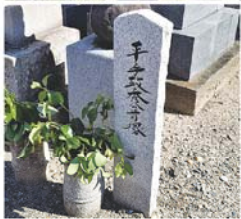
東雲寺(西区中田井1-331)にある首塚。当地の織田藤左衛門家へアピールする意味があったのかもしれない

歴史ライター。中日新聞Webで達人に訊け」で信長について連載中。鳴海中日文化センターでは若き信長と桶狭間の戦い、名所スタンプラリー講座」開講中。ローズ倶楽部でも現地歩き講座を開催。