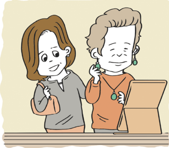
イラスト/ヤギ ワタル

普段は宝石を身に着ける機会はないが、会食やパーティーの際に母の指輪をはめることがある。すると、喜々としてそれを眺めたり身に着けたりしていた母の、折々の姿がよみがえってきて、愛しさと懐かしさに包まれる。