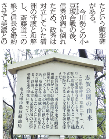
志賀公園の由来 この彰徳碑は、享和二年(一八一〇)に尾張藩有志により「平手政秀の城」を建てたことにちなんで建てられた。志賀公園には、信長が平手政秀の屋敷跡に建てたといわれる首塚がある。この彰徳碑は、西志賀土地区画整理組合がこの彰徳碑周辺地区に公園を整備し、昭和三十五年(一九六四)に「平手政秀の城」を建てたことにちなんで、昭和三十五年(一九六四)に「志賀公園」と命名された。この公園は、名古屋市北区の志賀地区にある。名古屋市農政緑地局

歴史ライター。中日新聞Webで達人に訊け」で信長について連載中。鳴海中日文化センターでは若き信長と桶狭間の戦い、名所スタンプラリー講座」開講中。ローズ倶楽部でも現地歩き講座を開催。