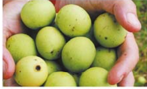
▲厳しい自然環境で生き抜くために、固い皮で包まれたマルラの実。甘酸っぱく、栄養豊富なので野生の象も好んで食べるそう。