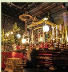
国宝御影堂の内陣