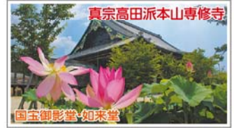
真宗高田派本山専修寺