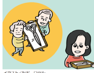
イラスト/ヤキ ワタル

なつて十一年、祖父が亡くなつて二十八年が過ぎていた。つまり、我家の鉄が作られなくなつてから十年以上経つていたわけだ。それなのに、母は商標を更新した。決して認知症のせいではない。 祖父は現代の名工に選ばれ、勲六等瑞宝章を授けられた鉄職人だった。頑固一徹で偏屈だったが、真っ正直で誠実な性格で、母は人間的には父よりも祖父を信頼していた。工場の経営に