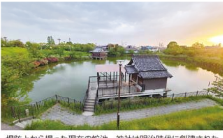
堤防上から撮った現在の蛇池。神社は明治時代に創建された

不安のないセカンドライフのために 退職金個別相談会 申し込みフォーム https://www.chunichi-bb.co.jp/t/ 4携帯・スマホはこちから お問い合わせ先 052-218-3332 (株)中目BBB