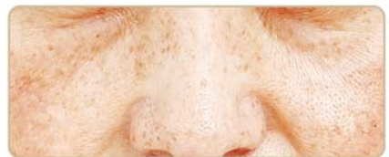
老人性色素斑のある肌